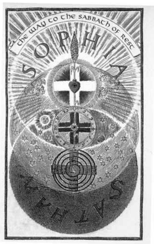
The Way to the Sabbath of Rest or, the Soul's Progress in the work of the New-Birth